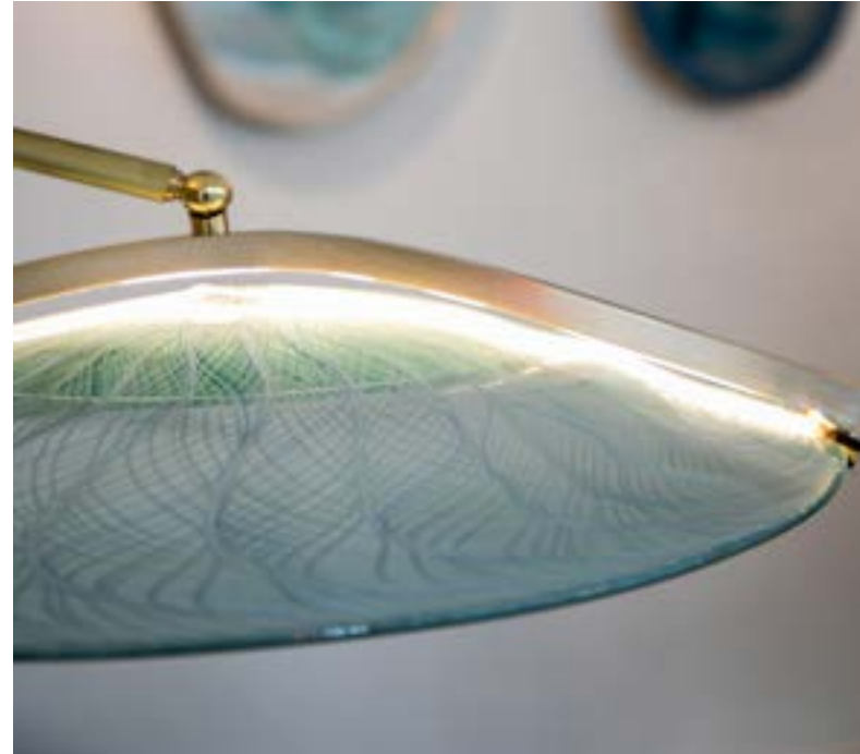
Lampadaire Ikat :

Lampadaire autour du fil. ikat est une technique de tissage polynésienne, qui correspond à une épargne du tissage au moment de la teinture. L'aspect brute de la pierre et du laiton mettent en exergue le dessin léger de la technique traditionnelle du filigrane.