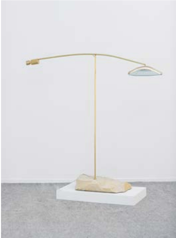
Pierre de Caen Verre Soufflé filigrané blanc twist, fond bleu claire Structure en laiton Eclairage LED 3000k dimension : 1200 x 1200 mm